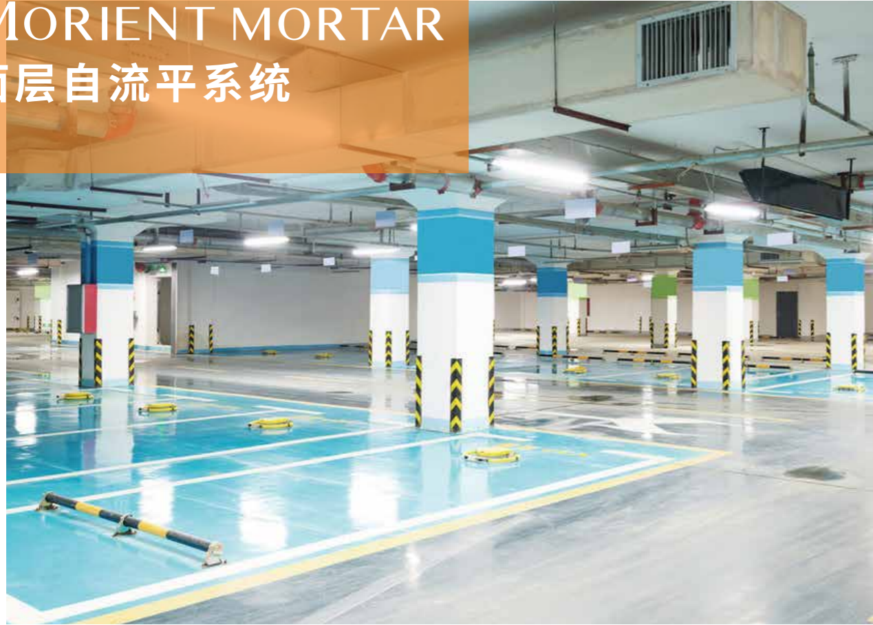
system for abrasion-resistance floors; thickness 5 to 25 mm. 快速固化, 具有高度耐磨性的水泥基自流平地坪系统; 厚度5-25MM。