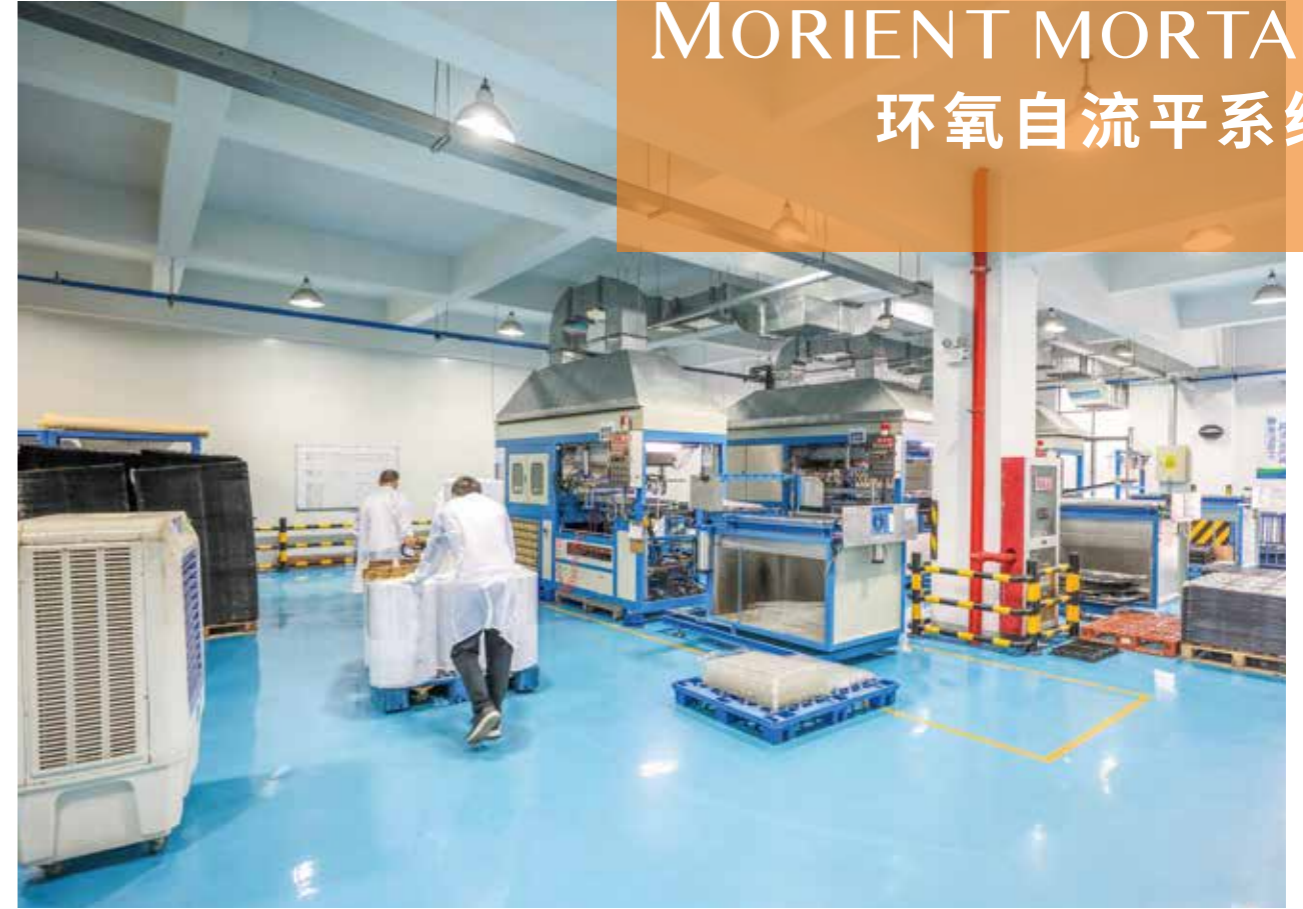
Self-levelling epoxy system for industrial floor; thickness 2-4mm. 用于工业地坪的无溶剂, 环氧自流平系统; 厚度为2至4MM。